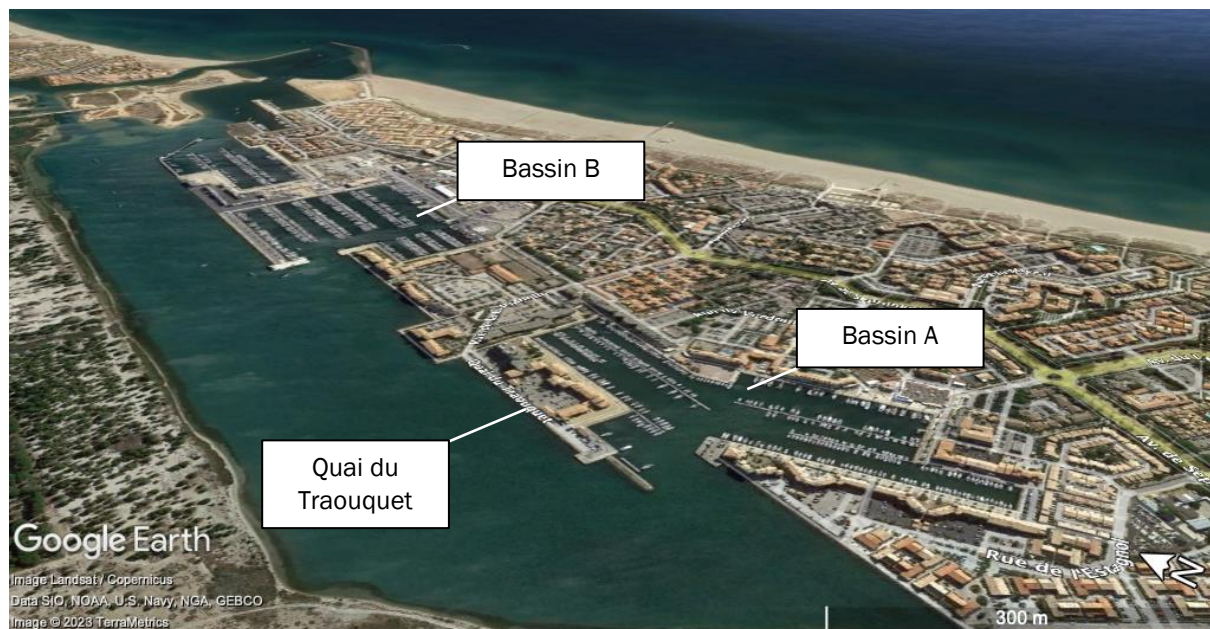
Photo 1 : Vue Google Earth® de la zone projet (imagerie satellitaire en date du 18/07/2020)

Si le modèle économique et touristique de Leucate basé sur le programme de la mission Racine a bien répondu aux objectifs qui étaient fixés, à savoir le développement en masse de la côte, il apparaît indispensable et opportun aujourd'hui de faire évoluer l'offre touristique afin de s'adapter au marché et d'améliorer les retombées économiques. La Ville de Leucate cherche à pallier la coupure urbanistique présente sur le port, entre les bassins A et B, et à développer un projet de Smart Port City, en initiant le renouveau de la station.