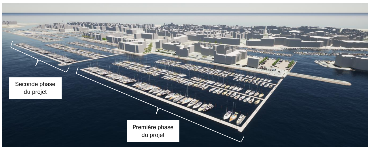
Figure 3 : Esquisse 3D de l'état projeté avec 522 postes d'amarrages supplémentaires

Le coût global du projet dans sa première tranche de réalisation est estimé à 6 881 873 € H.T.