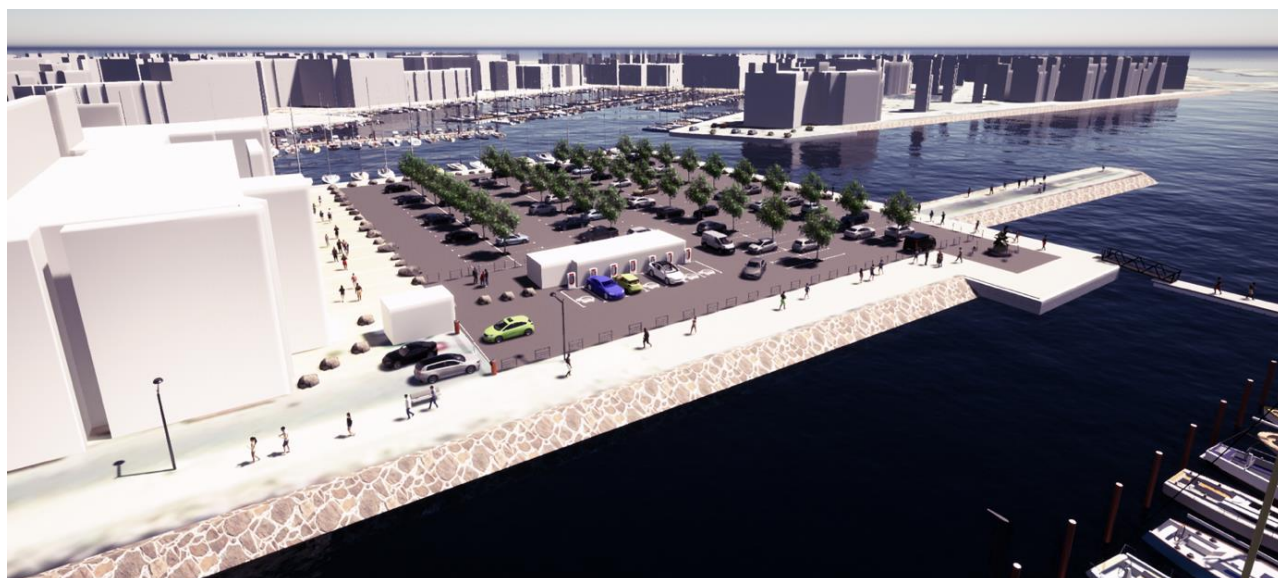
Figure 4 : Esquisse 3D de l'état projeté du parking de 203 places