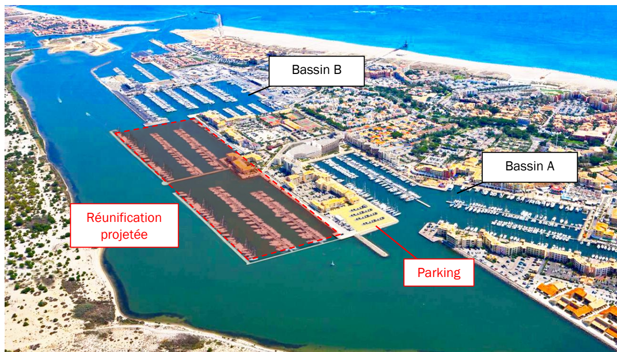
Figure 2 : Photomontage de l'extension de Port Leucate (cf. état actuel Photo 1)